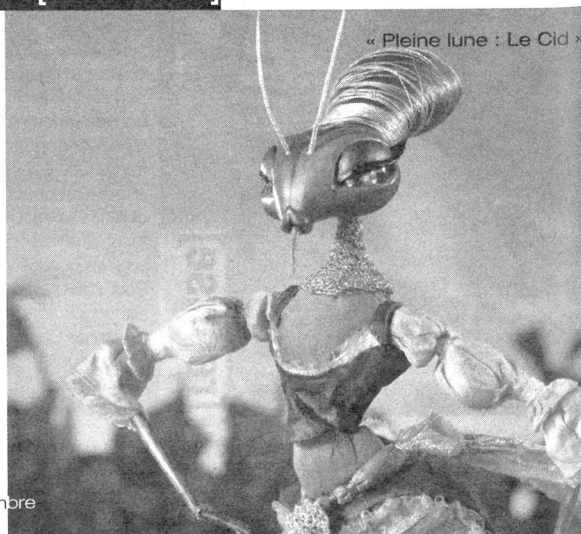
« Pleine lune : Le Cid »

Pour une fois, des courts métrages d'animation destinés aux plus grands, c'est-à-dire aux plus de 10 ans. Folimage a rassemblé sous le titre « Pleine Lune » plusieurs films, tous primés dans des festivals internationaux. Au programme, « Le Cid » d'Emmanuelle Gorgiard, une adaptation en marionnettes articulées de la pièce de Corneille, interprétée par des insectes sur une musique flamenco. Les autres films : « L'Homme aux bras ballants », de Laurent Gorgiard, « Le Jour de gloire », « Le Dos au mur » et « R.I.P. » de Bruno Collet. ■