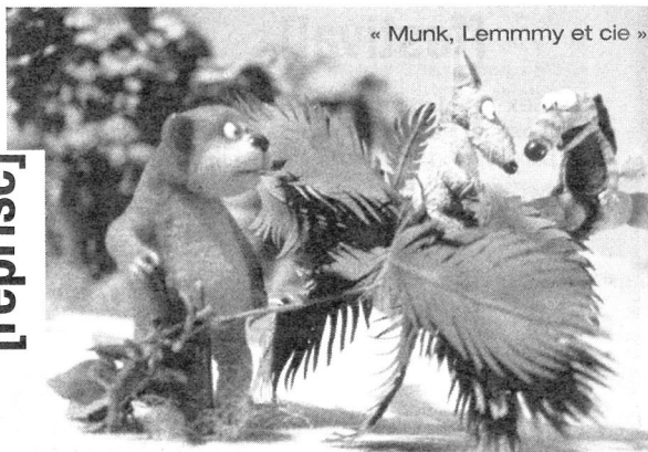
« Munk, Lemmy et cie »

Un chien maigrelet et un nounours costaud, Munk et Lemmy, sont toujours en quête de victuailles afin de combler leur prodigieux appétit. Dans leur forêt, (au décor parfois exotique ou bien préhistorique), leur quête rencontre bien des obstacles. Cinq courts métrages mettent en scène ces marionnettes, deux autres sont adaptés de la série « Les espiègles », d'après des bandes dessinées de W. Busch. Sans parole mais avec de nombreux bruits – couinements, gloussements, piailllements –, ce programme de films courts est plein d'humour, parfaitement adapté aux petits : une bonne introduction au cinéma d'animation letton, plein de bonnes surprises. A voir dans le cadre de « L'enfance de l'art », jusqu'à la fin de l'année. ■